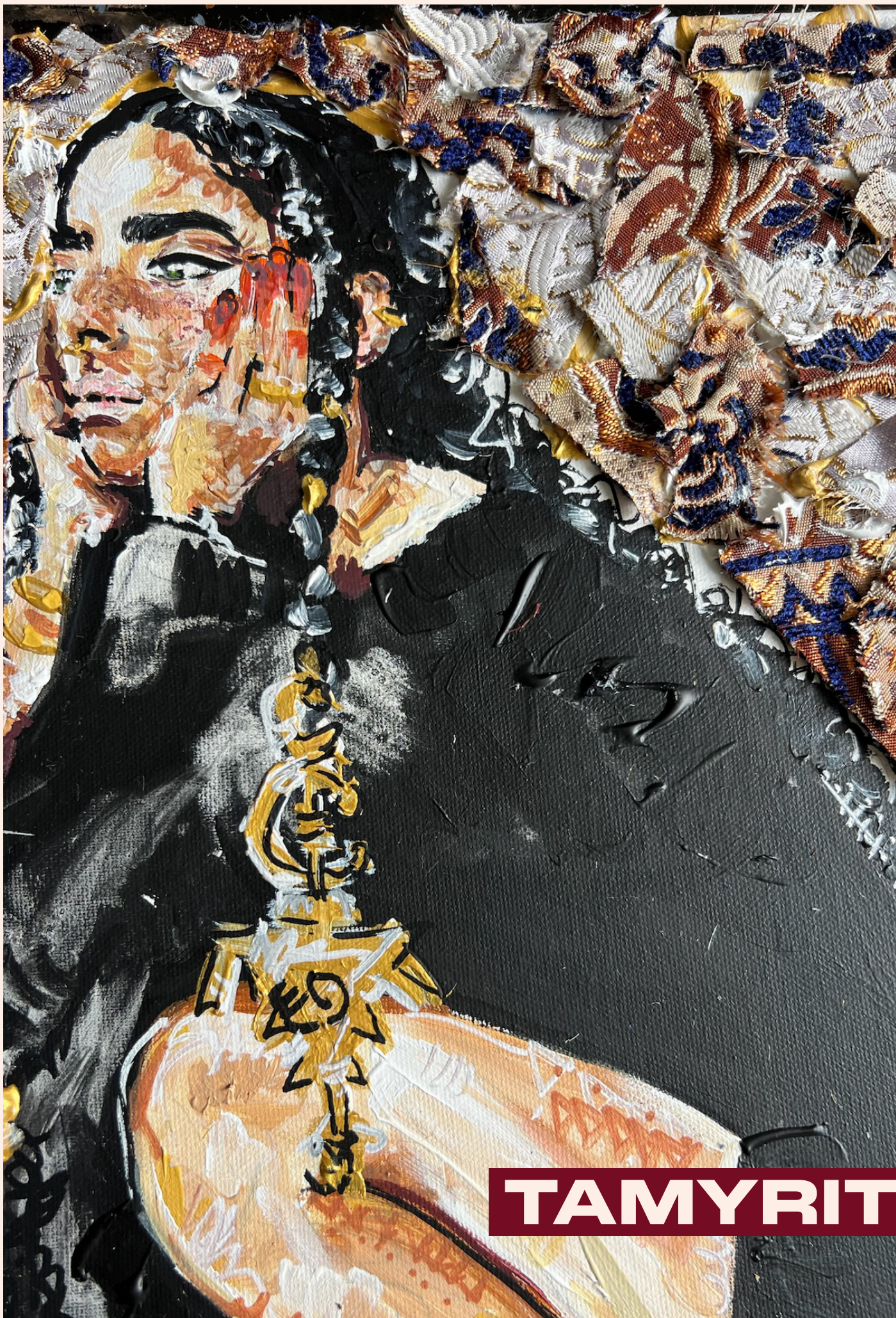
Peinture acrylique, Tissus, Septembre 2025, 41 x 33 cm