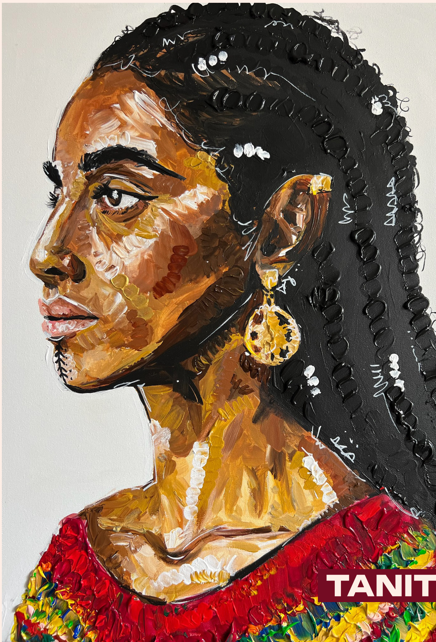
Peinture acrylique, Juillet 2025, 60 x 50 cm