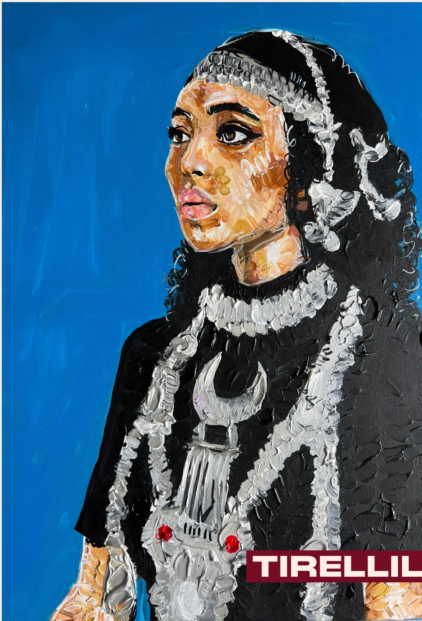
Peinture acrylique, 2026, 60 cm x 50 cm