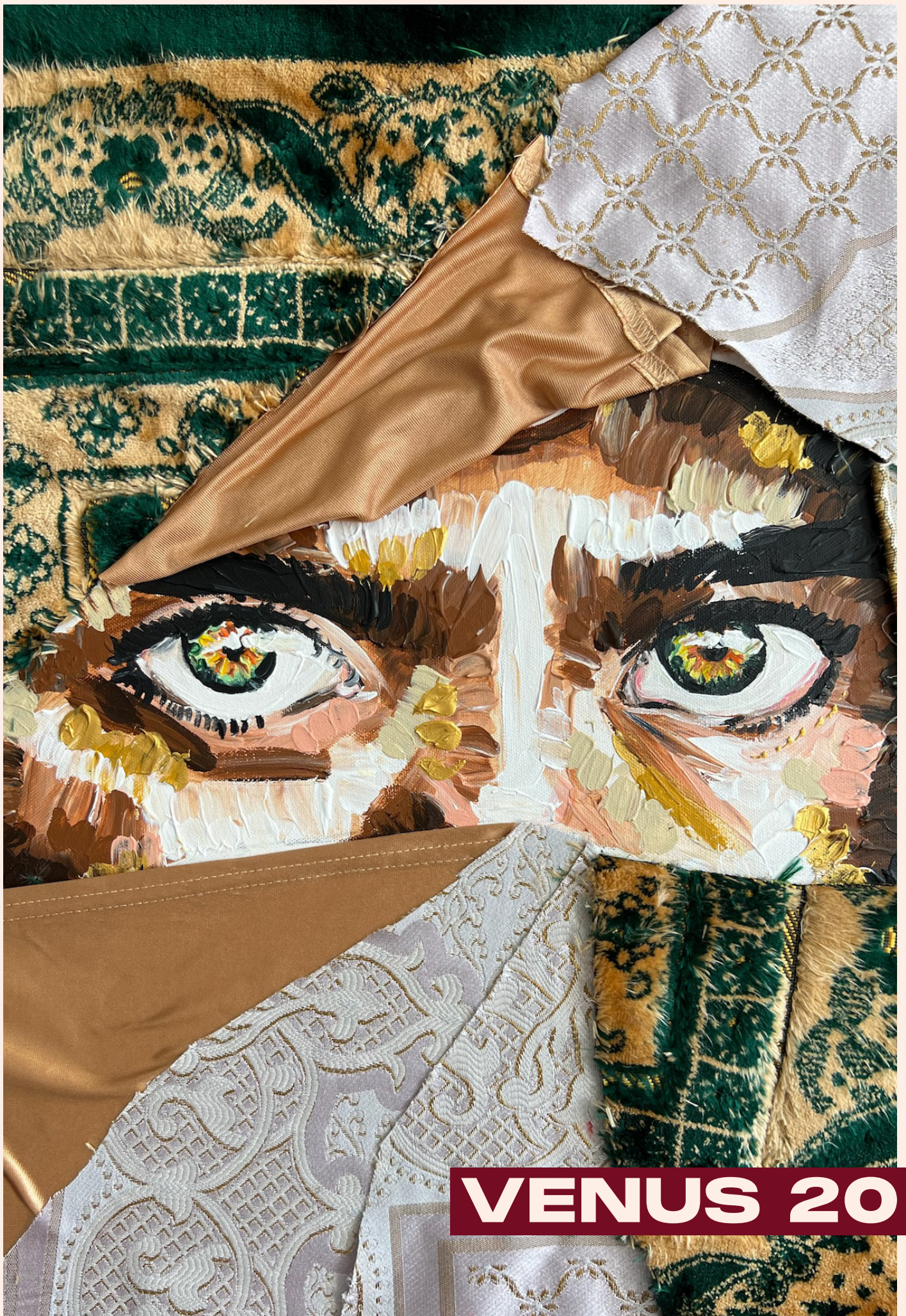
Peinture acrylique, tissus cousus mains, 2026, 60 cm x 50 cm