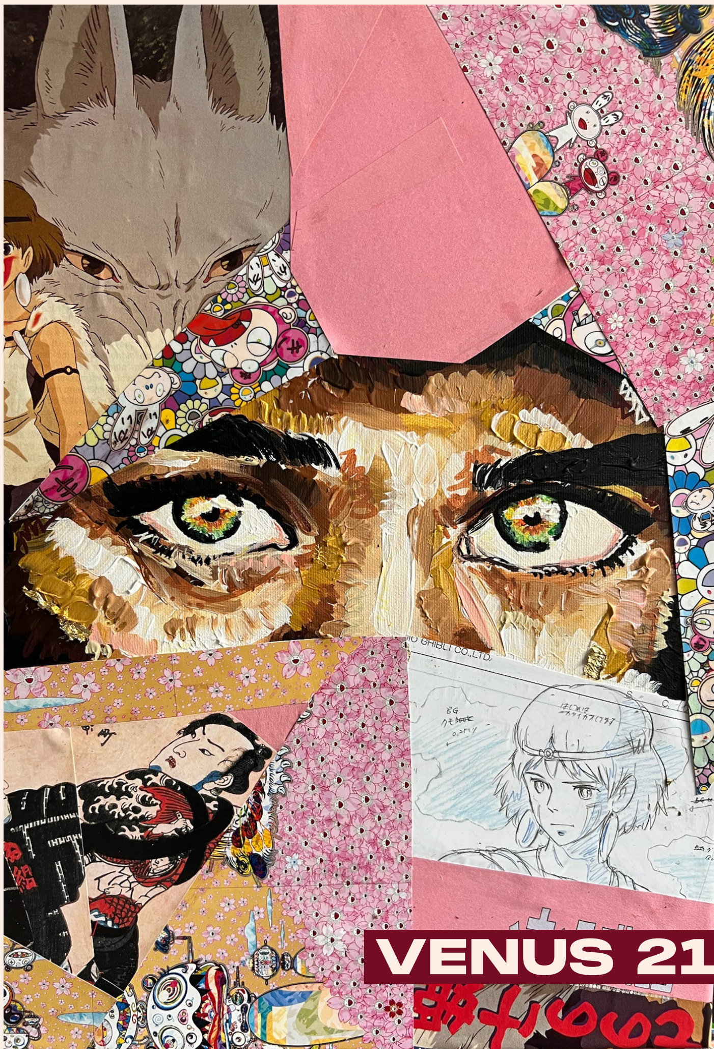
Peinture acrylique, Collage, Septembre 2025, 41 x 33 cm