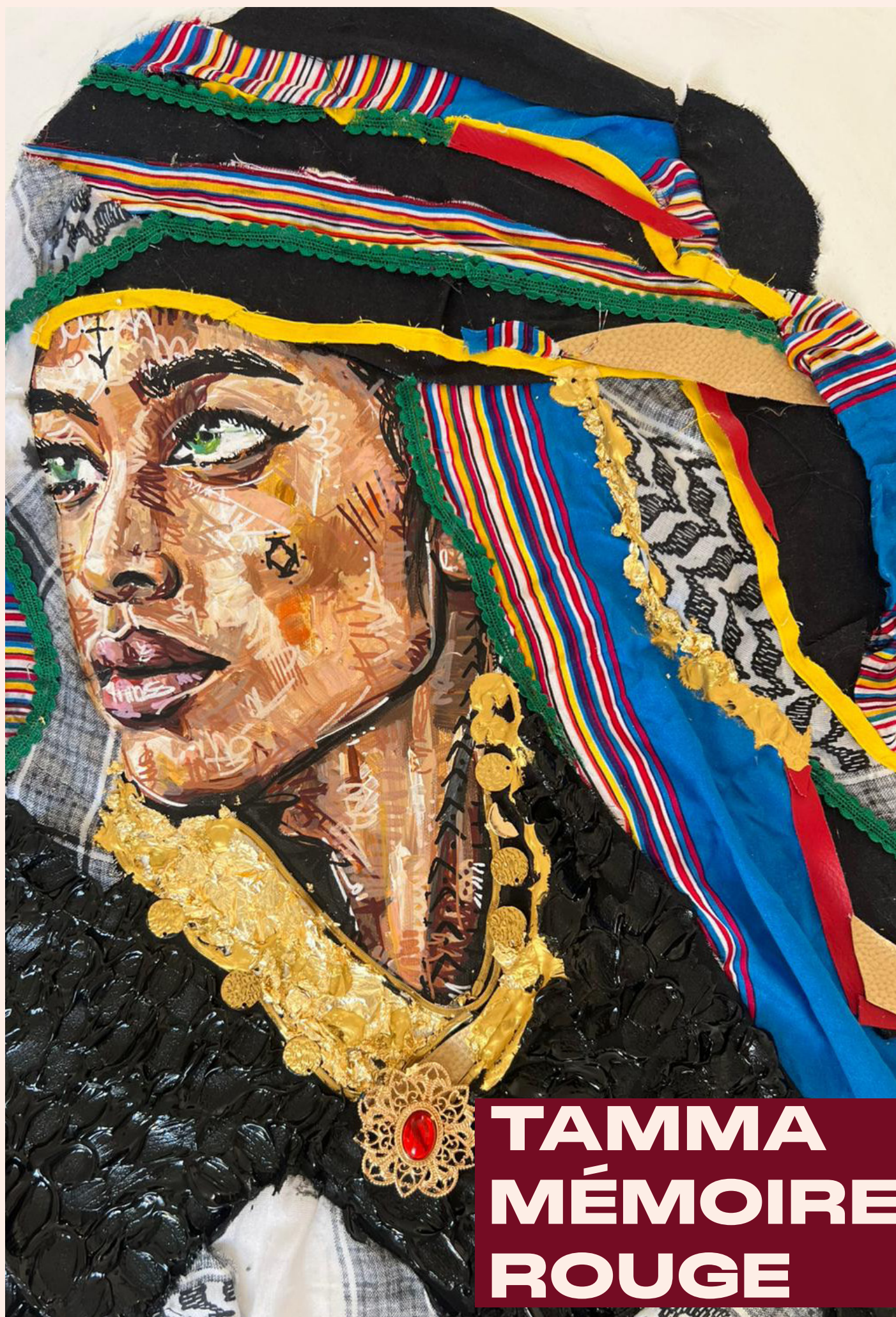
Peinture acrylique, collage tissus, feuille dorée et posca, 2026, 60 cm x 50 cm