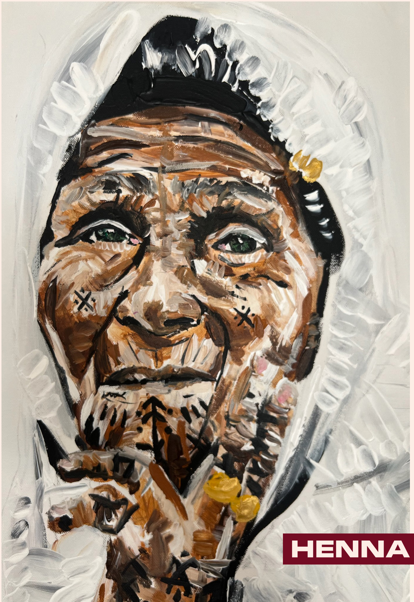
Peinture acrylique, Avril 2024, 60 x 50 cm