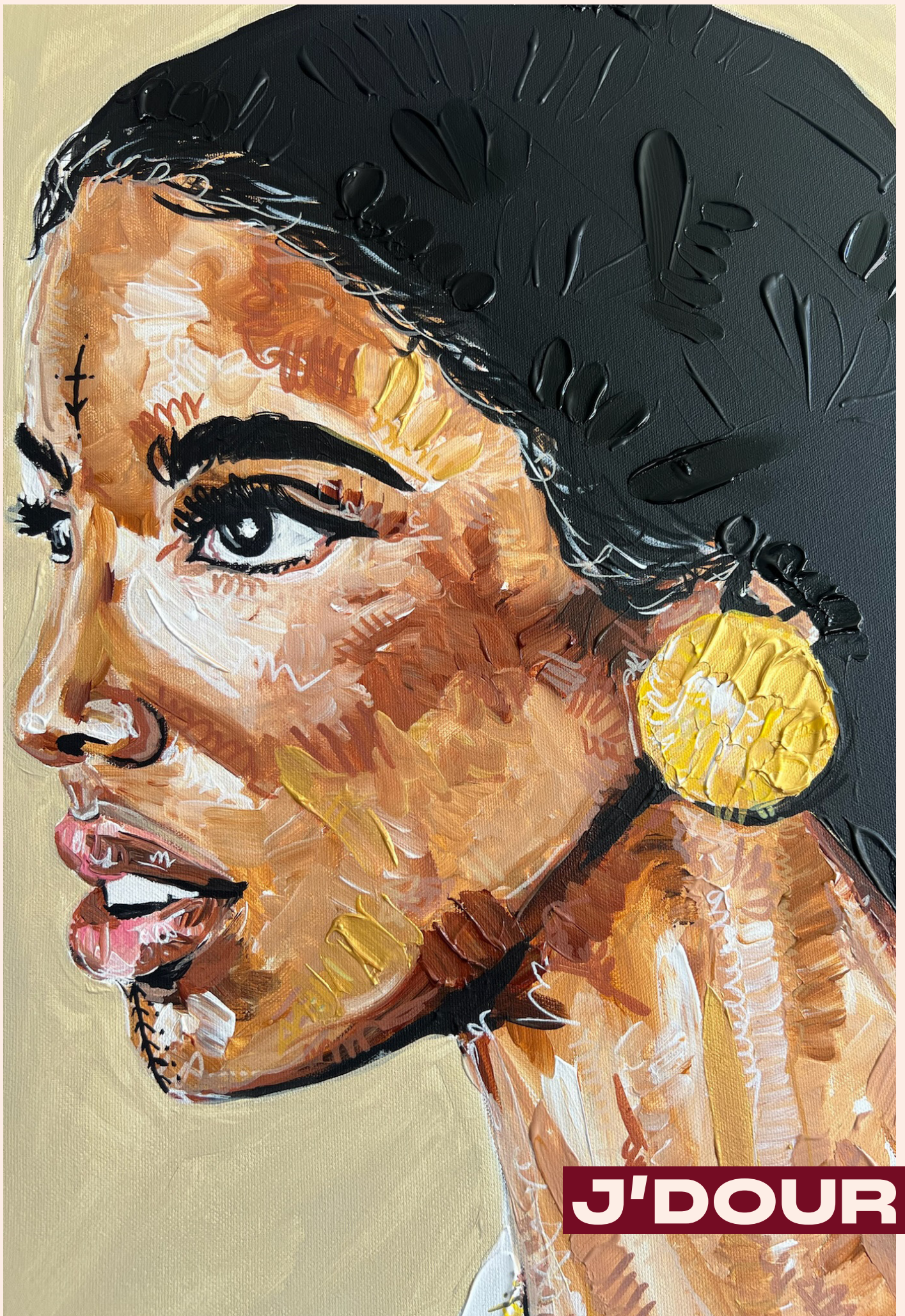
Peinture acrylique, Mai 2025, 60 x 50 cm