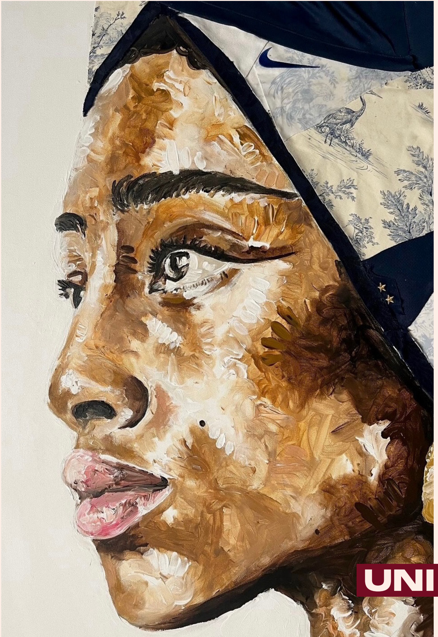
Peinture acrylique, Collage tissu, Novembre 2022, 100 x 80 cm